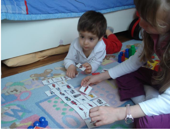
Resim 2.3: Eşleştirme kartları öğretici ve eğlendirici oyunlardır.

Birbirinin aynı olan iki nesneyi bir araya getirme becerisidir. Çocuklara resimler karışık olarak verilir, resimli kartlar ya da objeler arasından birbirinin aynı olan iki şekli ya da objeyi bulup yan yana veya üst üste koyması istenir. Çocuğun tüm kartları dikkatle incelemesi, aynı olanları bir araya getirmesi gerekir. Bellek kartları, dominolar, resimli tombalalar eşleştirme oyunlarıdır. Çocuk evde yalnız ya da annesiyle birlikteyken çoraplarını, eldivenlerini, patiklerini vb. nesnelere bir araya getirerek eşleştirebilir.