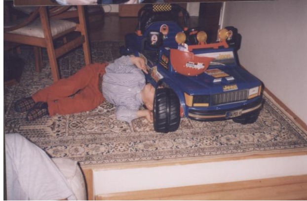
Resim 2.9: Oyun yoluyla çocuk gerçek hayatı keşfeder.