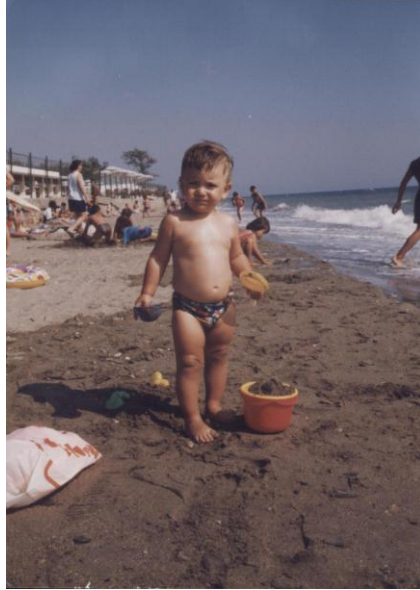
Resim 1.4: Kumda oynamak, çocuğu hem eğlendirir hem rahatlatır.

Oyunların vazgeçilmez öğeleri olan oyuncaklar, çocuğun bilişsel, bedensel ve psikososyal gelişimine yardımcı olur. Bir yandan eğlenceli anlar yaratırken diğer yandan da etkili bir eğitimsel görev üstlenir. Oyuncak, bebeği oyalayarak annenin rahat etmesini sağlayacak bir nesne olarak değil, önemli bir eğitim aracı olarak görülmelidir.