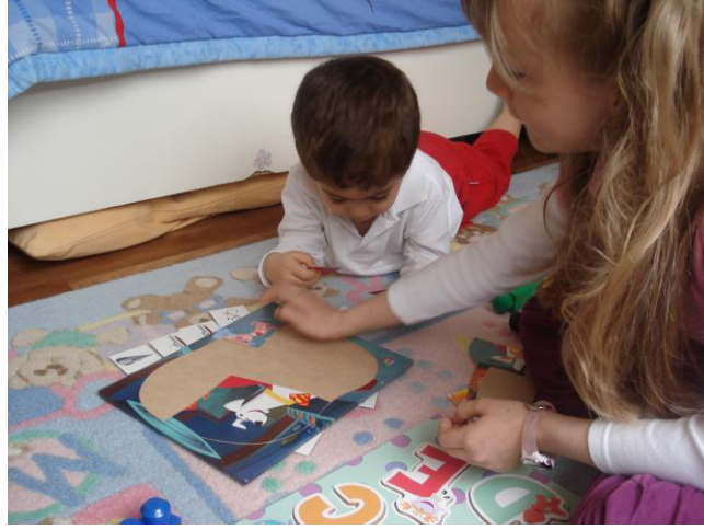
Resim 2.5: Yapbozlar iliřki kurmanın alt basamaklarındandır.