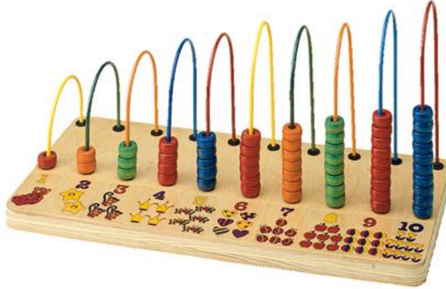
Resim 1.21: Hem renk hem de sayı kavramını destekleyen eğitici bir oyuncak