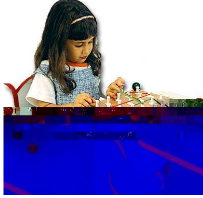
Resim 2.8: Eğitici oyuncaklar, çocuğa hazır bulunuşluk ilkesine uygun verilmelidir.