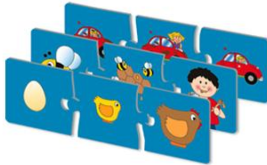
Resim 2.6: Olayları oluş sırasına göre sıralamaya bir örnek

Nesnelere herhangi bir özellik açısından sıralamadır. Örneğin, büyükten küçüğe ya da küçükten büyüğe doğru, azdan çoğa, çoktan aza, renkleri tonlarına göre, olayları oluş sırasına göre sıralama vb.