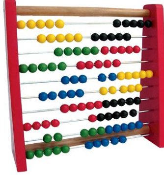
Resim 1.18: Sayı kavramını destekleyen oyuncaklardan abaküs