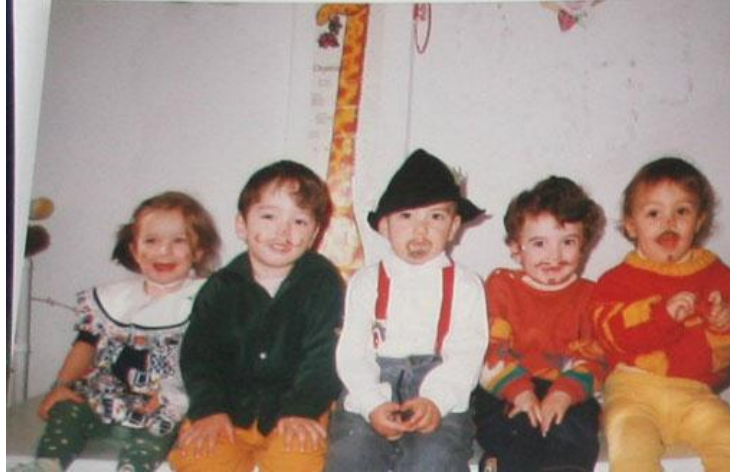
Resim 1.2: Oyun çocuğun hayal gücünü geliştirir.

Oyunun çocuğun gelişimine olan önemi saymakla bitmez. Çocuk oyun oynarken oyuncakları ile kendisine ayrı bir dünya yaratır. Oyunların vazgeçilmez öğeleri olan oyuncaklar çocuğun bilişsel, bedensel ve psikososyal gelişimlerini destekleyen, hayal gücünü ve yaratıcılığını geliştiren en değerli araçlardır.