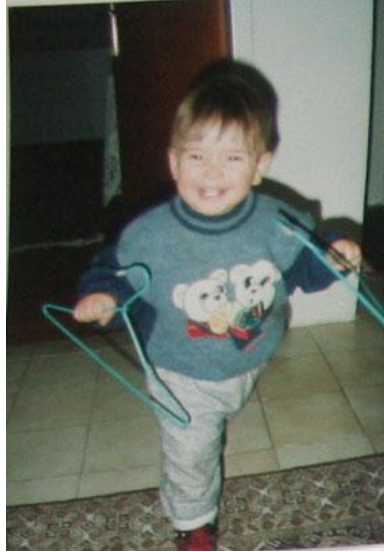
Resim 1.6: Çocuk için her şey bir oyuncak olarak düşünülebilir.