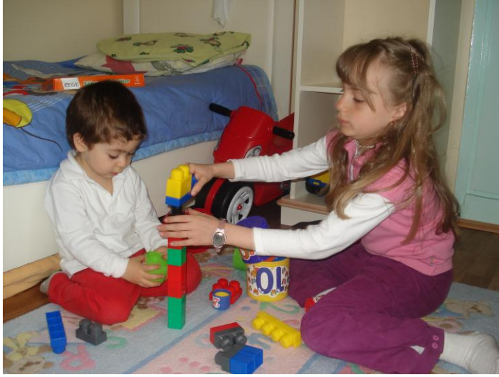
Resim 2.7: Çocuk, oyun yoluyla öğrenir.