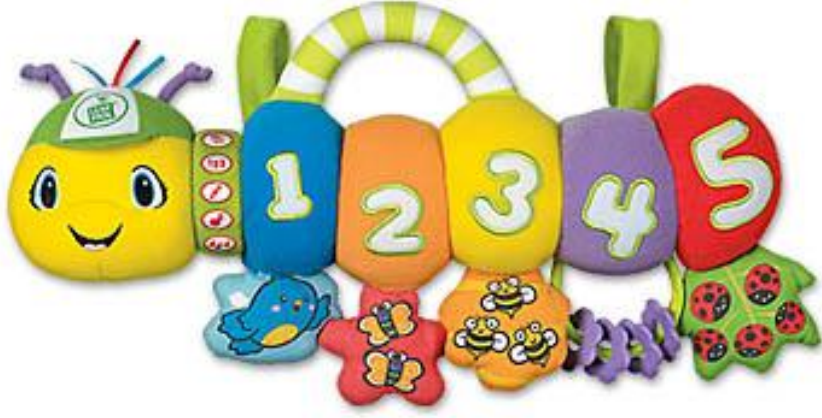
Resim 1.8: 0–3 yaş döneminde çocuğun yatağına takılabilecek eğitici bir oyuncak