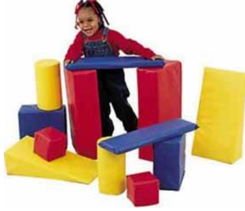
Resim 1.13: Şekil kavramını destekleyen eğitici bir oyuncak

kazandırılabilir. Öğretmen; üçgen, yuvarlak, daire şeklinde çomak kuklalar hazırlayarak öykü anlatabilir.