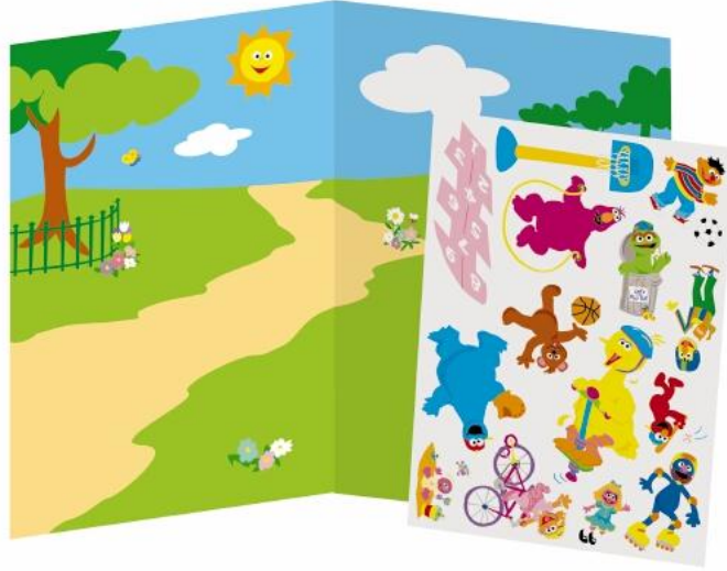
Resim 1.10: Bilişsel gelişimi destekleyen eğitici bir oyuncak