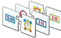
Resim 1.15: Zaman kavramını gösteren bir örnek

Çocukta zaman kavramının gelişimi için bilişsel bir yapılaşmanın oluşmasına gereksinim vardır. 4 yaşına kadar çocuklar daha çok şimdiki zamanla ilgilenir. Sınıfta ekilen bir fidenin gelişimi zaman kavramını geliştirici bir çalışmadır.