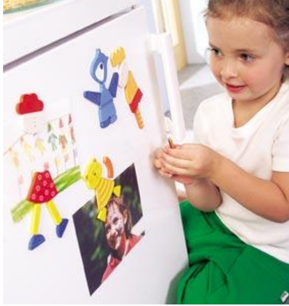
Resim 1.11: Kartlarla yeni bir hikâye oluşturma dil gelişimini destekler.

Sosyal ve duygusal gelişiminin desteklenmesinde eğitici oyuncakların önemi şunlardır: