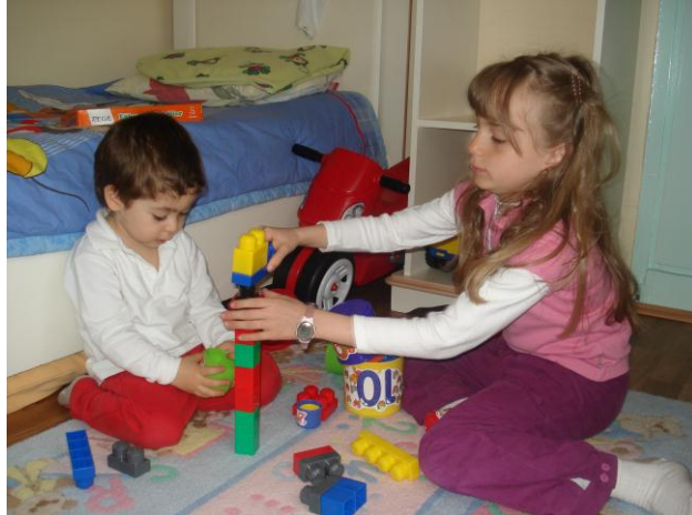
Resim 1.9: Eğitici oyuncaklar sayesinde çocuk pek çok kavramı öğrenir.

Erken çocukluk döneminde çocuğun sembelleri kullanma, algılama, yeni kavramlar oluşturma gibi bilişsel becerilerinin ve tüm gelişimlerinin desteklenmesi için eğitici oyuncakları kullanması yararlıdır.