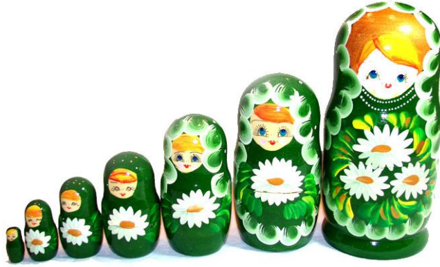
Resim 1.22: Boyut kavramını geliştirici oyuncaklara bir örnek

Boyut kavramına ait ilk davranışlar 2-3 yaşındaki çocuklarda büyük-küçük olanı tanıma ve ayırt etme ile ortaya çıkmaktadır.