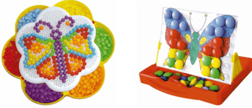
Resim 1.19-20: Boncuklarla oluşturulan şekiller, renk kavramını destekler.

Renk kavramı, çocukta 2 yaşından sonra gelişmeye başlar. Çocuklar zıt renkleri daha kolay öğrenir. Çeşitli dominolar, kartlar, sesli renk kutuları tombalalar hazırlanarak renk kavramı oyun yoluyla öğretilir.