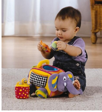
Resim 1.3: Oyuncaklar çocuğu eğlendirirken eğitir.

Bebekler doğar doğmaz duyu organları aracılığı ile dış dünyayı tanımaya başlar. Çevresinde bulunan her nesne onun için uyarıcı ve öğretici niteliğindedir. Hızla büyüdüğü ve değiştiği ilk yıllarda oyun ve oyuncaklar, bebeğin neredeyse tüm zamanını alır.