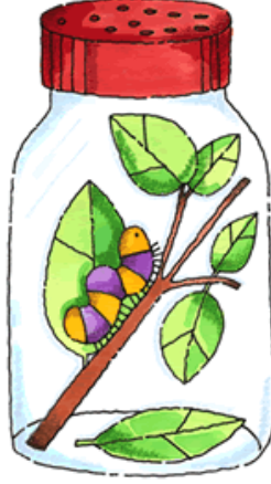
Resim 1.23: Gözlem becerisinin gelişmesini sağlayan oyuncaklara bir örnek

Bu etkinlikler çocukların gelişimsel özellikleri ve bireysel farklılıkları dikkate alınarak basitten zora doğru planlanmalıdır.