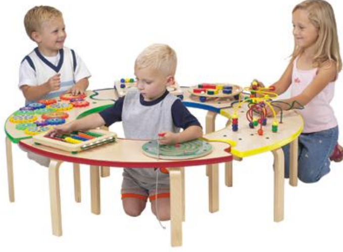
Resim 1.12: Grup hâlinde oynanan oyunlar, sosyal gelişimi, duygusal gelişimi destekler.

Motor gelişiminin desteklenmesinde eğitici oyuncakların önemi şunlardır: