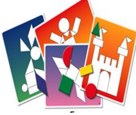
Resim 2.2: Eşleştirme ile hem renk hem de şekil kavramı verilebilir.