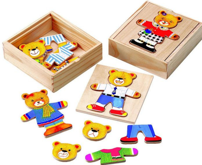
Resim 2.4: İlişki kurma oyunlarına bir örnek

İlişki kurma oyuncaklarında çocuktan belli bir özellik açısından verilen ilişkiyi algılaması ve ayırt etmesi istenir. Parçaları birleştirerek resmin bütünü oluşturma, kullanıldığı yere ya da kullanım amacına göre ilişkili olanları veya belli bir özellik açısından (örneğin; renk) aynı olan ancak diğer tüm özellikleri farklı olanları bir araya getirme söz konusudur.