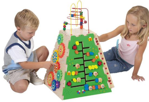
Resim 1.7: Çocukların gelişim seviyelerine göre eğitici oyuncaklar değişiklik gösterir.

Bebeklikten itibaren eğitici oyuncaklar, çocuğun gelişiminde önemli rol oynamaktadır.