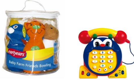
Resim 1.5: Oyuncaklar çocuğun gelişimine uygun olarak seçilmelidir.