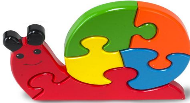
Resim 1.26: Oyuncaklar sadece çocukları oyalamaz, aynı zamanda bilişsel fonksiyonlarını da geliştirir.