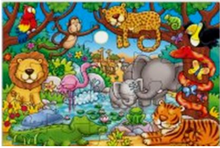
Resim 1.25: Çocuklar, oyuncakları ile oynarken problemleri çözmesini de öğrenirler.