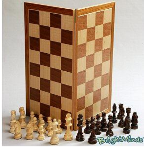
Resim 1.24: Satranç ve dama