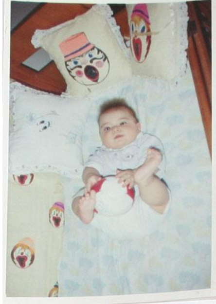
Resim 1.1: Oyun, hayatın ilk yıllarından itibaren önemlidir.

Oyunun çocuğun gelişimine olan önemi saymakla bitmez. Çocuk oyun oynarken oyuncakları ile kendisine ayrı bir dünya yaratır. Oyunların vazgeçilmez öğeleri olan oyuncaklar çocuğun bilişsel, bedensel ve psikososyal gelişimlerini destekleyen, hayal gücünü ve yaratıcılığını geliştiren en değerli araçlardır.