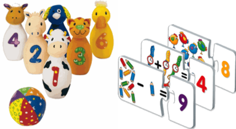
Resim 1.17: Oyuncaklar yardımı ile çocuklar sayı kavramını sıkılmadan öğrenir.

Çocuklara saymayı öğretmek, sayıları tanıtmak, sayıların birbirleriyle olan ilişkisini kavramlarına yardım etmek amacıyla yapılan etkinliklerdir. Tüm kavramlarda olduğu gibi bu dönemde kazanılan sayısal bilgiler çocuğun eğitimi için sağlam bir temel oluşturur. Oyuncaklar basitten karmaşığa, kolaydan zora doğru hazırlanmalıdır.