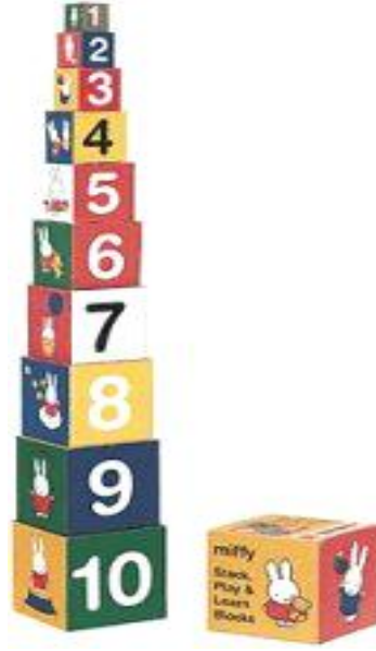
Resim 2.1: Çeşitli kavramların (sayı, boyut vb.) kazandırılmasında kullanılabilecek eğitici bir oyuncak