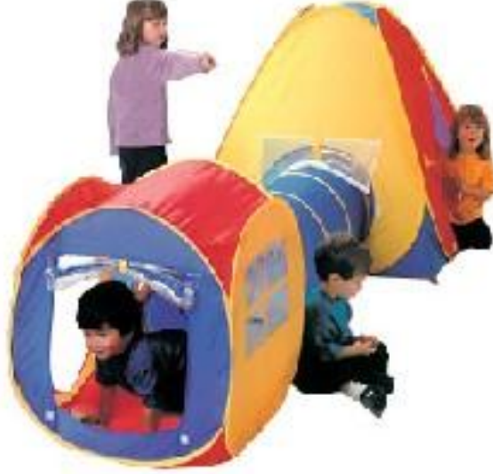
Resim 1.16: Bu çadırla oynarken, çocuklara mekân kavramı verilebilir.

Uzayda konum kavramı ile ilgili hazırlanmış pek çok kart, çocuklar tarafından bireysel ya da grupça oynanabilmektedir. Öğretmen, mekânda konum kavramı ile ilgili pek çok kart hazırlayabilir ve öyküler oluşturabilir.